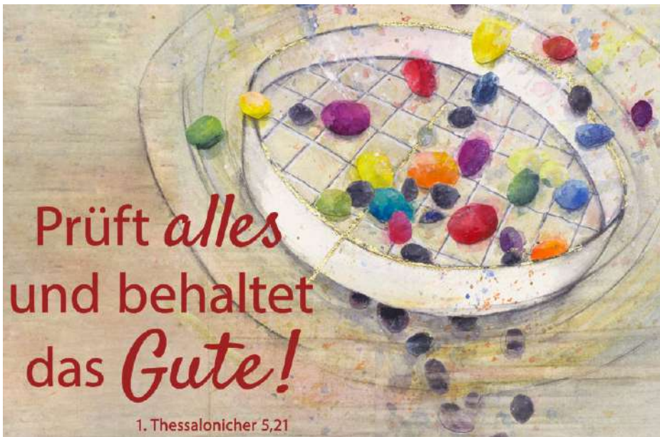
Titelfotos: Pastor von der Weppen Heft: Grafiken: freepik.com, Fotos Anke Suckau, Thomas von der Weppen, Katja Middelhoff Bild Jahreslosung: Motiv von Stefanie Bahlinger, Mössingen, www.verlagambirnbach.de

Liebe Leserinnen, liebe Leser, im letzten Jahr haben wir die Nachbargemeinden vorgestellt. Kirche wird in den nächsten Jahren weiter zusammenwachsen. Wer aber ist überhaupt Kirche? Wer ist Gemeinde? Wer gehört denn eigentlich dazu? Darauf gibt es verschiedene Antworten. Man kann das ganz formell angehen (Kirchenmitglieder) oder theologisch (alle Getauften – oder doch mehr??). Ich versuche in dieser und den nächsten Ausgaben mal eine andere Antwort zu geben. Vielleicht mögen Sie ja dazu Stellung nehmen, dann bitte gerne Zuschriften an mich. Wir beginnen heute mit der „Aktiven Gemeinde“. Die „Aktive Gemeinde“ hat man früher auch gerne Kerngemeinde genannt. Dazu gehören neben denen, die beruflich ihr Geld damit verdienen, alle, die sich in verschiedenen Bereichen mit ihren Fähigkeiten einbringen. Man könnte von den „amtlichen“ Gemeindegliedern sprechen. Sie bekleiden über längere Zeit ein Amt in der Gemeinde (Kirchengemeinderat, Gruppenleiter, o. ä.) und bestimmen so das Bild der Gemeinde. Sie werden häufig mit Kirche identifiziert. Wenn wir zu Beginn des Jahres unsere „Aktiven“ einladen, versenden wir ca. 200 Einladungen an Menschen, die Zeit für die Gemeinde und Kirche zur