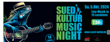
Grafik: Sabine Schnell

Im Oktober gibt es wieder die SuedKultur MusicNight. Für einmalig 7,50 Euro erhält man Einlass in 15 verschiedene Einrichtungen und kann so am Samstag, 5. Oktober, Musik satt erleben. Auch die Marmstorfer Kirche wird wieder ein Ort sein, wo das möglich ist. Vorgeesehenes Programm: 19.00 Uhr: Connexion 20.00 Uhr: Southern Girls 21.00 Uhr: MMWillenlos