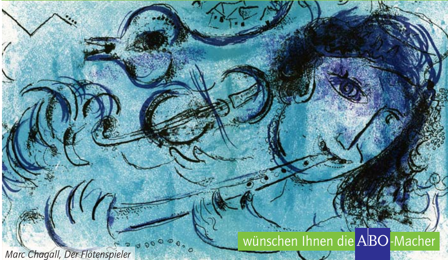
Marc Chagall, Der Flötenspieler