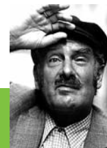
Jürgen von Manger

Der Mensch ist ein Abbild Gottes. Und wie es nicht das eine Bild Gottes gibt (deshalb das Bilderverbot: Wir sollen Gott nicht auf ein Bild festlegen), so gibt es also auch nicht den einen Men-