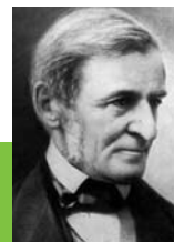
Ralph Waldo Emerson

Versuche niemals jemanden so zu machen, wie du selbst bist. Du solltest wissen, dass einer von deiner Sorte genug ist.