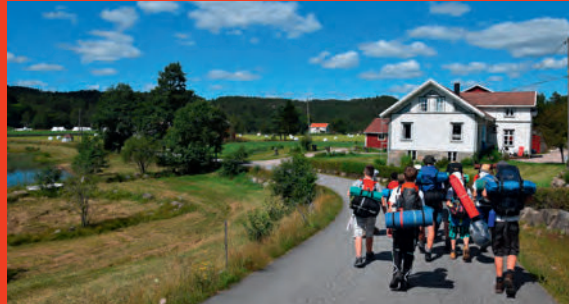
Natur, die zum Wandern und Entdecken einlädt.