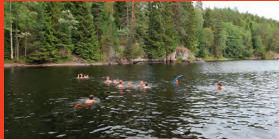
Weitere Fotos unter www.kirchemarmstorf.de